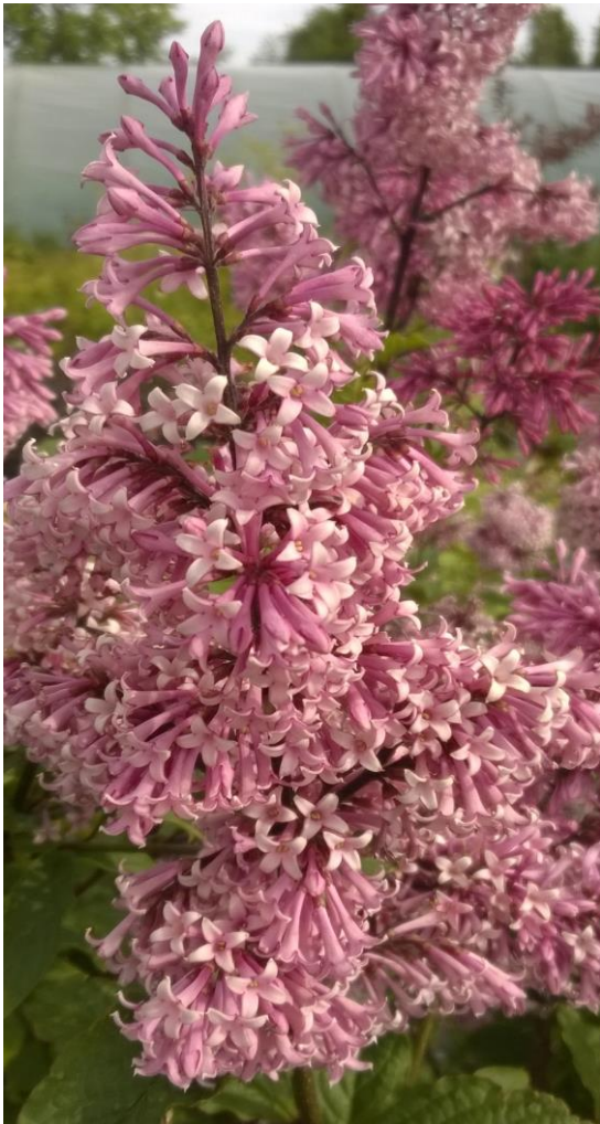
Puistosyreeni - Syringa x henryi 'Julia'

Kasvukaudella astiataimia saatavuuden mukaan.